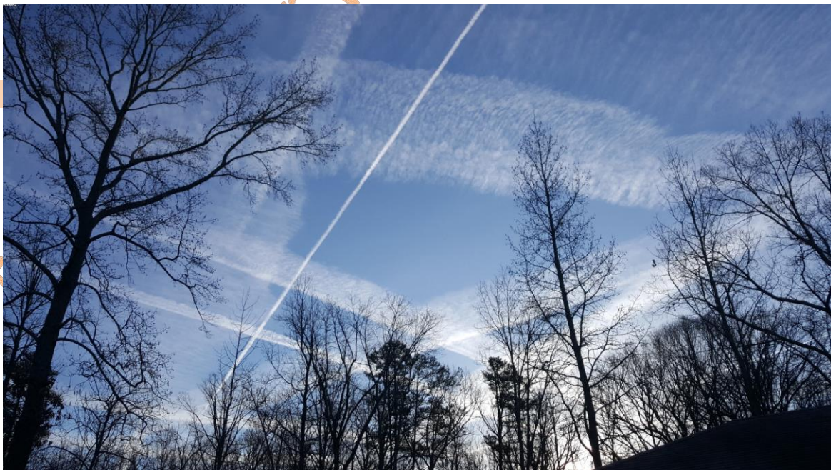
Figura 1: Estelas de cenizas volantes de carbón tóxicas dispersadas por medios aéreos sobre Soddy-Daisy, TN (USA)

----- Traducido por www.guardacielos.org